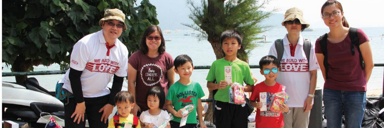
除了成人义工外，还有不少小朋友义工参与这次活动。