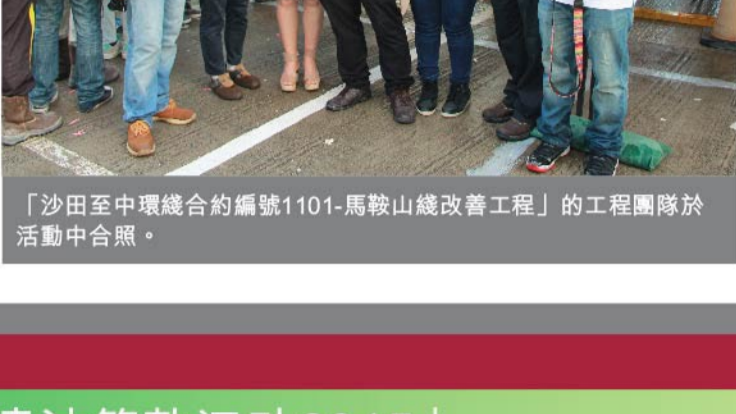
「沙田至中环线合约编号1101-马鞍山线改善工程」的工程团队于活动中合照。

新福港一直重视「品质」、「安全」和「环保」，同时会以关怀社区为目标，尽力照顾附近居民和行人的感受，努力打造高效工程。