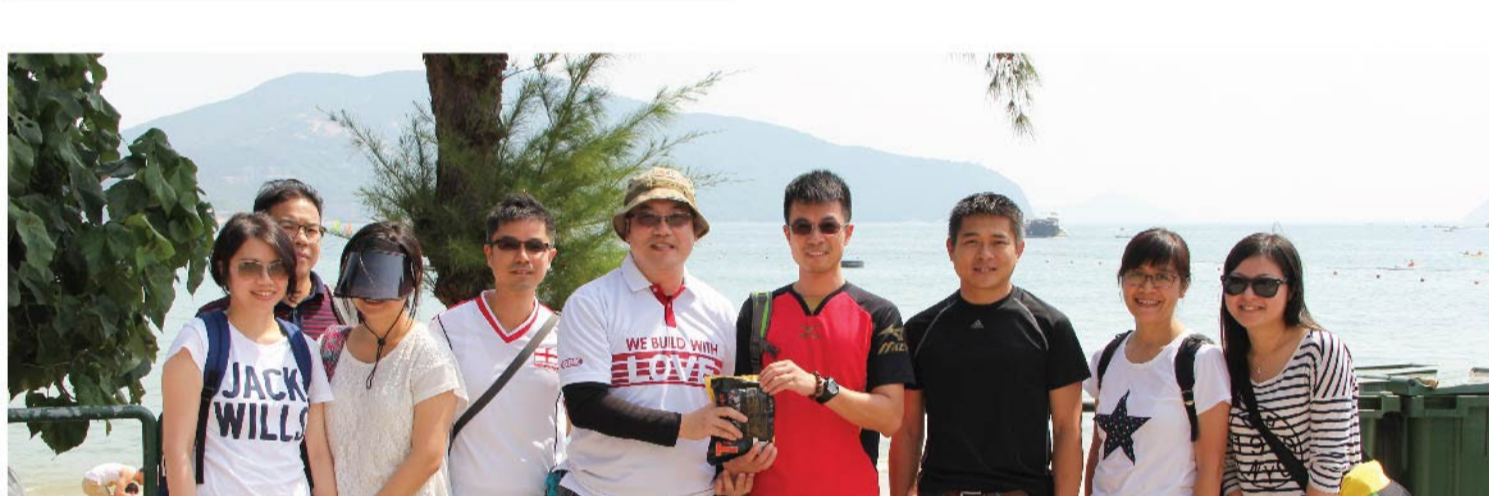
集团向「最重垃圾大奖」的得奖组别颁发小礼物，以示鼓励。

新福港于未来会继续举办类似的活动，积极提升员工和合作伙伴的环保意识，与各界携手美化海岸环境、建造绿色生活。