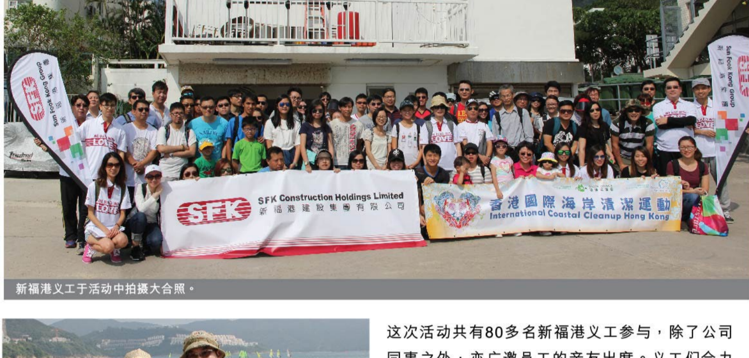
新福港义工于活动中拍摄大合照。

新福港于2015年10月18日与环保促进局合办「香港国际海岸清洁筹款运动2015」，积极提高员工对海岸清洁的意识，为清洁海滩出一分力，彰显企业社会责任和对香港海洋环境的关注。