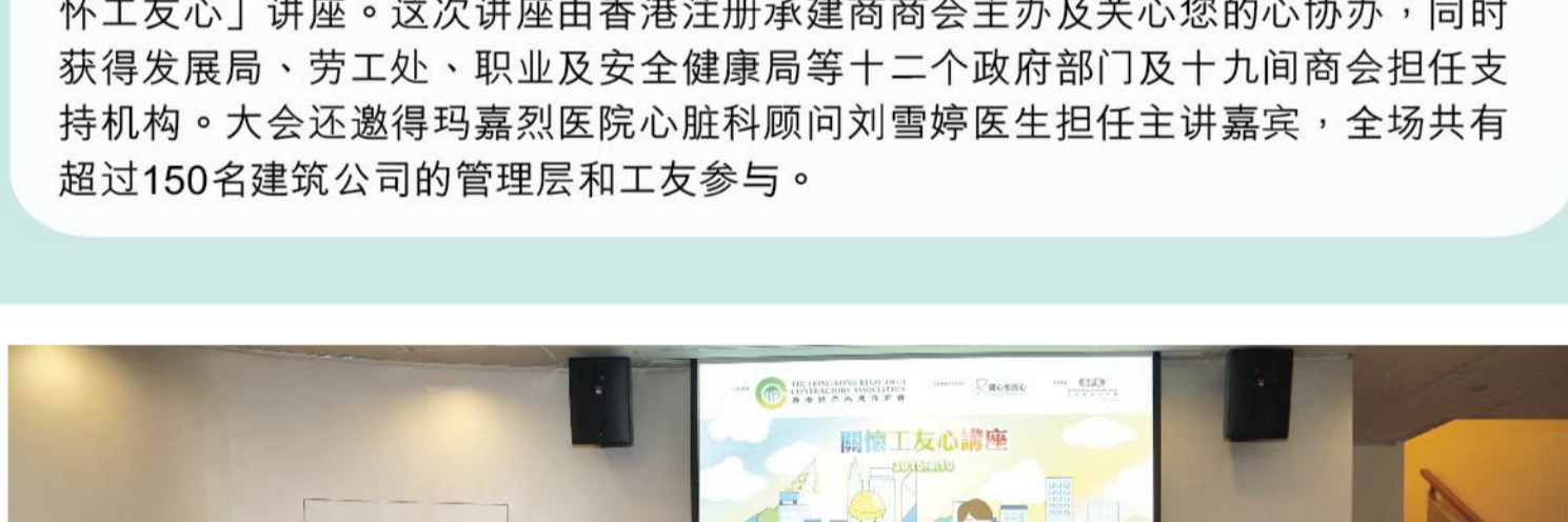
主办机构、协办机构及各政府部门支持机构的代表于活动中拍摄大合照。

为推动业界共同关注心脏健康，新福港在2015年8月10日积极协助业界筹办「关怀工友心」讲座。这次讲座由香港注册承建商商会主办及关心您的心协办，同时获得发展局、劳工处、职业及安全健康局等十二个政府部门及十九间商会担任支持机构。大会还邀得玛嘉烈医院心脏科顾问刘雪婷医生担任主讲嘉宾，全场共有超过150名建筑公司的管理层和工友参与。